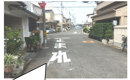
東浅香山校区内の道路の安全表示（複数）！

東浅香山1丁 スーパー開店と同時に、長年の砂利道が舗装されましたが、一部が 未舗装 、地元町会長の要望を受け、市に要請しこのたび 舗装が完了！