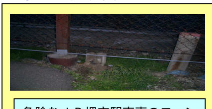
危険なJR堺市駅南東のフェンスを補修(こどもの安全のため)