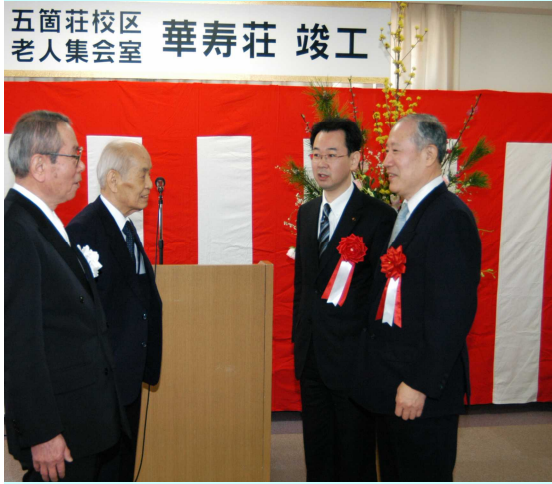
喜びの西嶋老人会長(左端)西顧問(左から2人目)