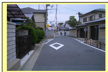
通学路の安全(道路標識、注意版) 五箇荘小校区通学路