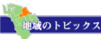
♻️ バリアフリー・段差の解消(宮本町)